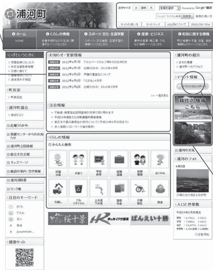
浦河町ホームページのトップページ

5つのメニューに分類し、クリックするとサブトップページを表示し、更に情報を分類して案内しています。