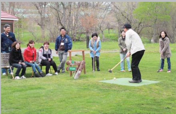
3チームに分かれアエルパークゴルフで交流

5月18日、町が主催する、3カ月～1年間、浦河赤十字病院で利用者を支えていただいている応援看護師を対象に、町内施設見学会を開催しました。 はじめに乗馬公園で乗馬体験を行いました。引き馬や指導を受けながらの手網操作など笑顔で取り組み、その後、BTC調教センターの直線調教馬場やJRA展望台など施設を見学しました。