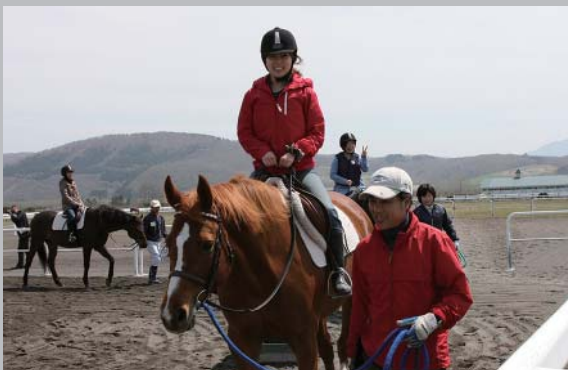
大好評の乗馬体験、皆さんすてきな笑顔でした

5月18日、町が主催する、3カ月～1年間、浦河赤十字病院で利用者を支えていただいている応援看護師を対象に、町内施設見学会を開催しました。 はじめに乗馬公園で乗馬体験を行いました。引き馬や指導を受けながらの手網操作など笑顔で取り組み、その後、BTC調教センターの直線調教馬場やJRA展望台など施設を見学しました。