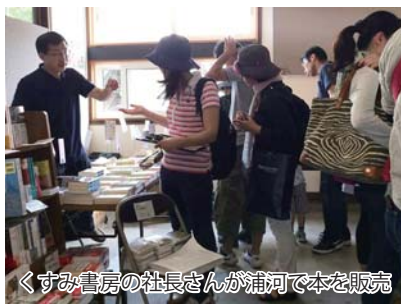
くすみ書房の社長さんが浦河で本を販売

今後、農業体験をメインにしたツアーやブックフェスの町内開催、また、都市部の若者に浦河をPRする事業など多くの企画を行っていきまので、ご協力お願いします。