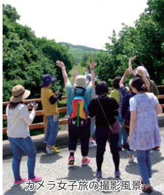
カメラ女子旅の撮影風景