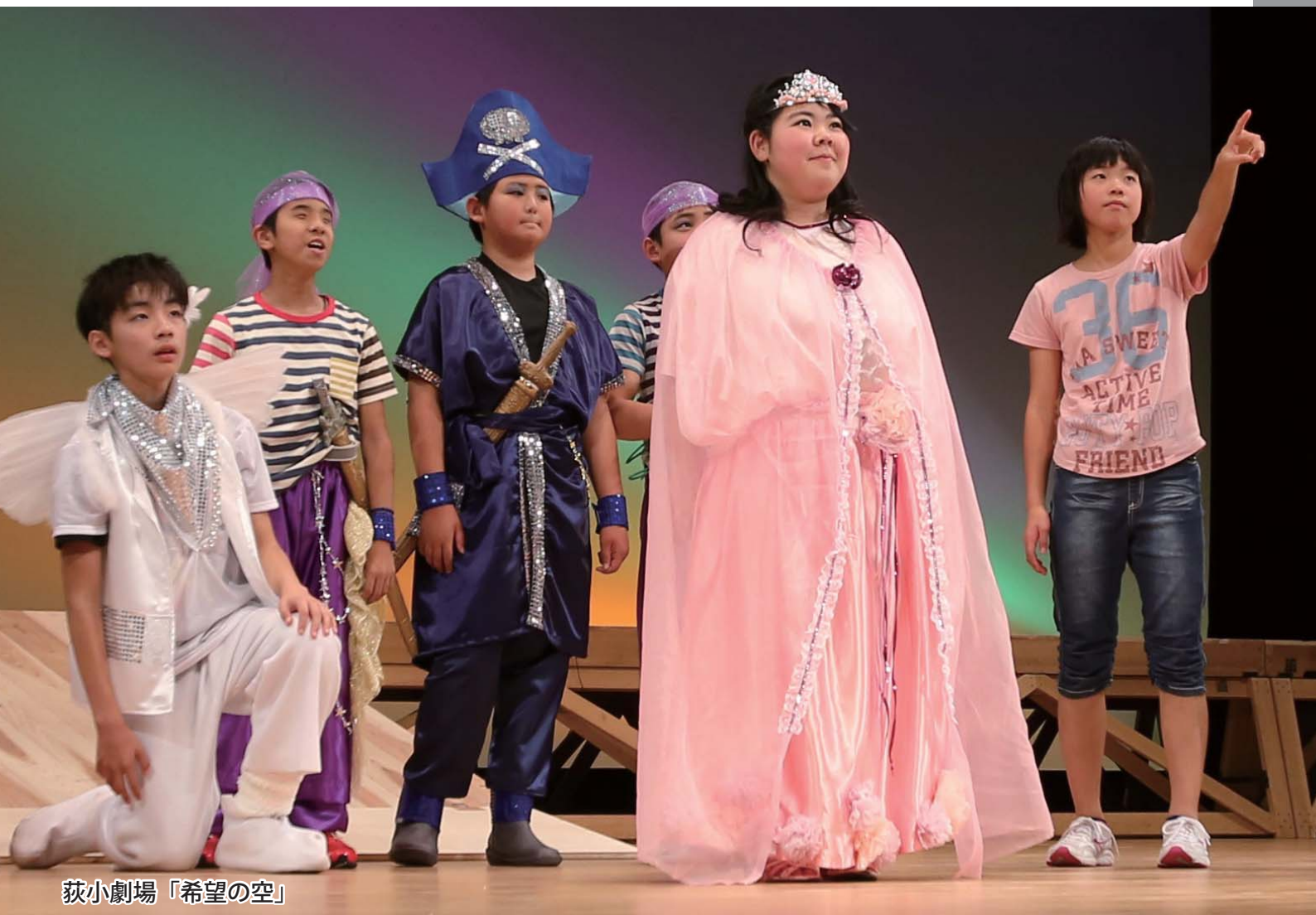
荻小劇場「希望の空」