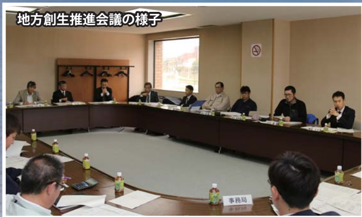
地方創生推進会議の様子