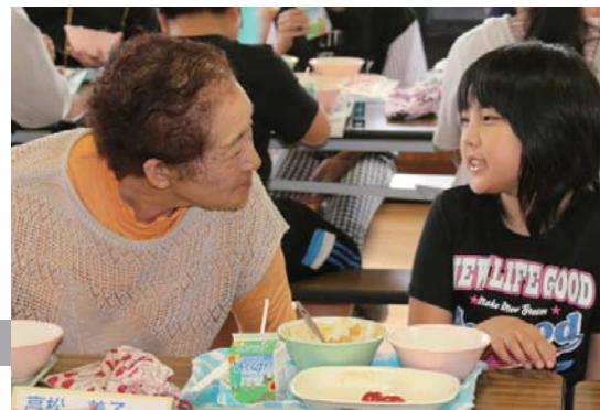
↑ 昨年の荻伏小学校での給食。今年も生産者や農協の方、町長・教育長がみなさんの学校と一緒に試食します。浦河の農産物について、色々聞いてみよう！